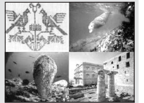
Il logo del convegno sul museo