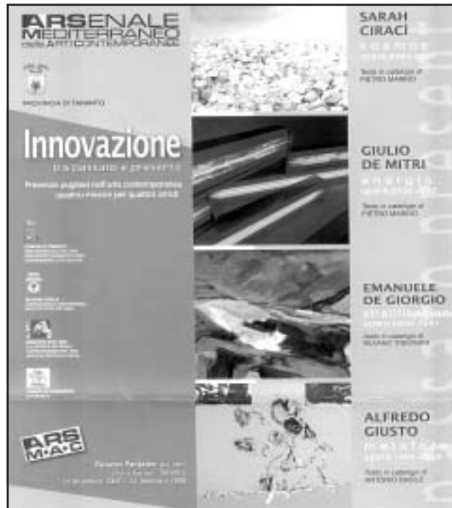
Nelle foto: in alto un momento della conferenza stampa. Qui sopra una locandina del progetto. Sotto: "Contadino ulivo e paesaggio" di De Giorgio; "Serigrafie Pace" di Giusto; "Linea blu" di Demitri; "2012 Globo" di Ciraci

immersi nel "presente" abbia inteso valorizzare percorsi di alta levatura teorico artistica, che hanno incarnato le potenzialità di una provincia, in genere condannata a un eterno ruolo di marginalità, in un Sud già tagliato fuori dai circuiti artistici, e la capacità di ambire a un ruolo di alta mediazione culturale. Se Emanuele De Giorgio aveva, già nella prima metà del Novecento, promosso una serie di attività culturali in grado di fare da trait-d'union tra il territorio pugliese e il panorama artistico internazionale, artisti viventi come Giulio De Mitri e la