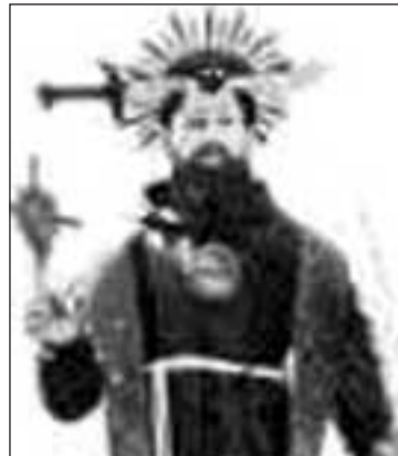
San Daniele Fasanella

esprime in senso lato questi concetti, ricordando che fu proprio S. Francesco d'Assisi a costruire il primo "Presepe di Greccio".