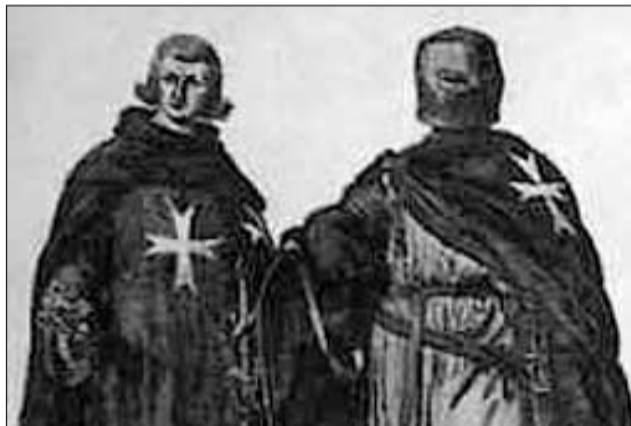
Cavalieri dell'Ordine di Malta

sotto la protezione di San Giovanni Battista e fu fondato circa mille anni fa dal Beato Fra' Gerardo di Amalfi per prestare assistenza ospedaliera e difesa militare ai numerosi pellegrini che si recavano in Terra Santa a visitare il Santo Sepolcro. Si stabilì inizialmente a Gerusalemme, quindi a San Gio-