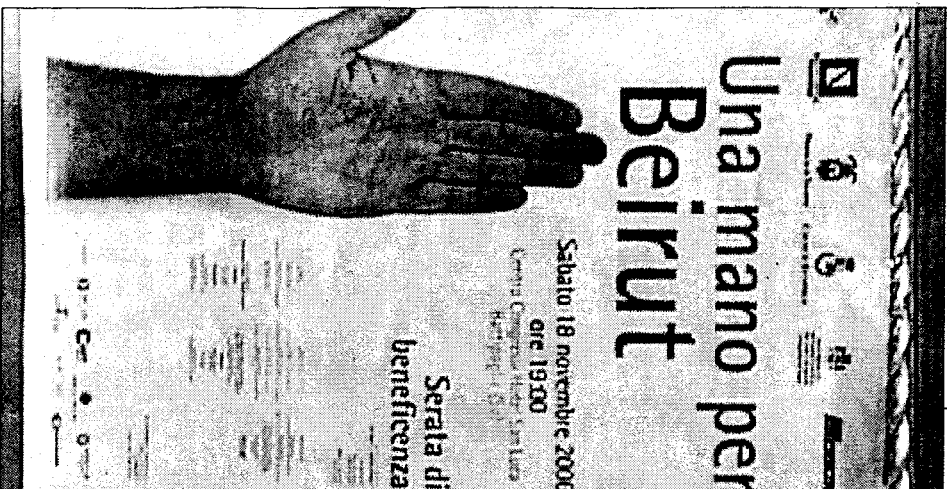
Il manifesto di Battipaglia per il Libano